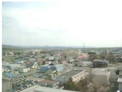
作業療法室からの景色 (市内が一望できます)