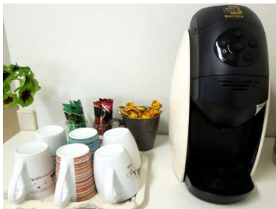
フリードリンクコーナー (ココアやコーヒーなど)