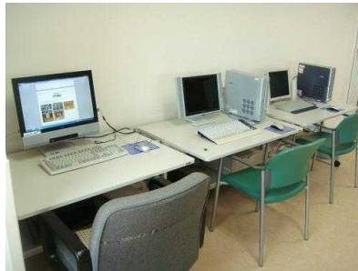
パソコン練習 (インターネット可)