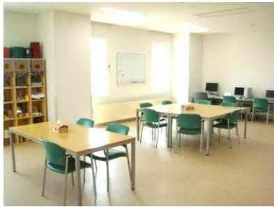
作業療法スペース

上記に当てはまる方には精神作業療法がピッタリです！！ぜひ、参加してみませんか？ 見学だけでもOKです！！