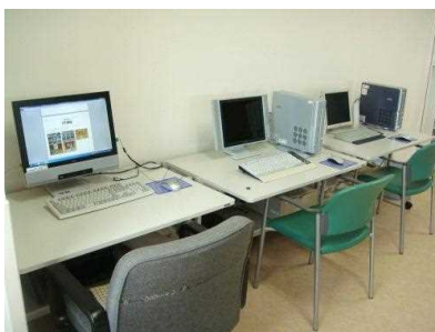
パソコン練習 (インターネット可)