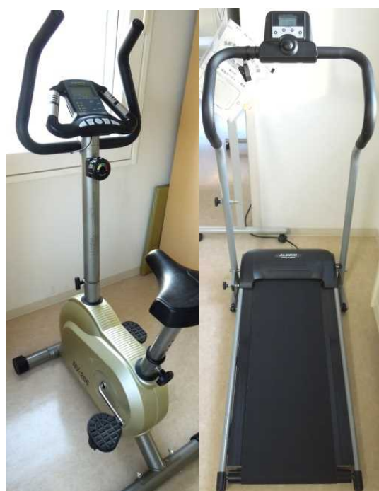
エアロバイクと電動ウォーキング マシンで運動も出来ます！