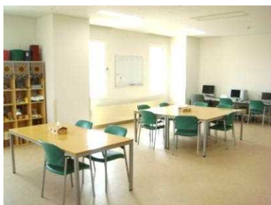
作業療法スペース

上記に当てはまる方には精神作業療法がピッタリです！！ぜひ、参加してみませんか？ 見学だけでもOKです！！