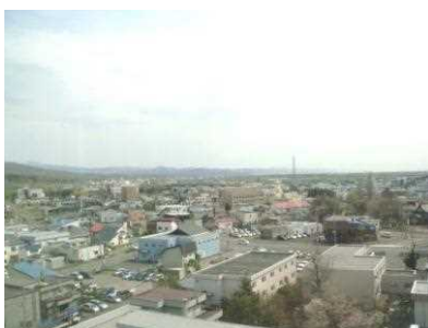
作業療法室からの景色 (市内が一望できます)