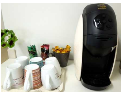
フリードリンクコーナー (ココアやコーヒーなど)