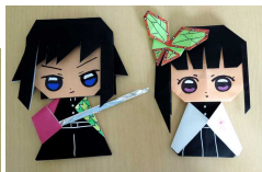
富岡義勇とカナヲ