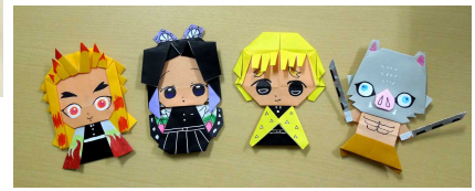
煉獄、胡蝶、善逸、伊之助

<栄養管理科> . . . 季節の行事に沿ったメッセージカードを作成。入院患者さんの給食時サプライズで添えてます♪