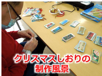
クリスマスしおりの制作風景