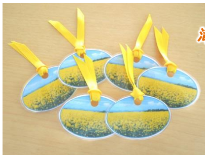
滝川市のシンボル！ ☆菜の花畑☆

(左) そろそろ寒い時期も終わり。春らしい桜のしおりを作成中です！ (右) 滝川市と言えば、菜の花！滝川市のシンボルをしおりにしました♪ 菜の花まつりなど観光に来た方にも配りたい、と想像をふくらませながら みなさん楽しく作っています☆