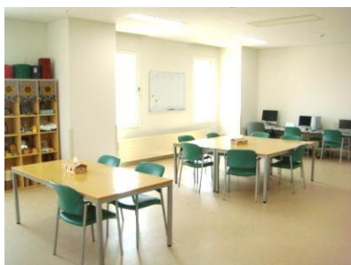
作業療法スペース

上記に当てはまる方には精神作業療法がピッタリです！！ぜひ、参加してみませんか？ 見学だけでもOKです！！