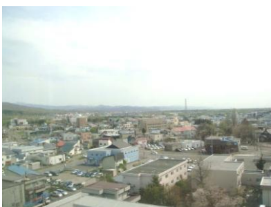
作業療法室からの景色 (市内が一望できます)