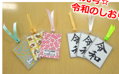
新元号☆ 令和のしおり！