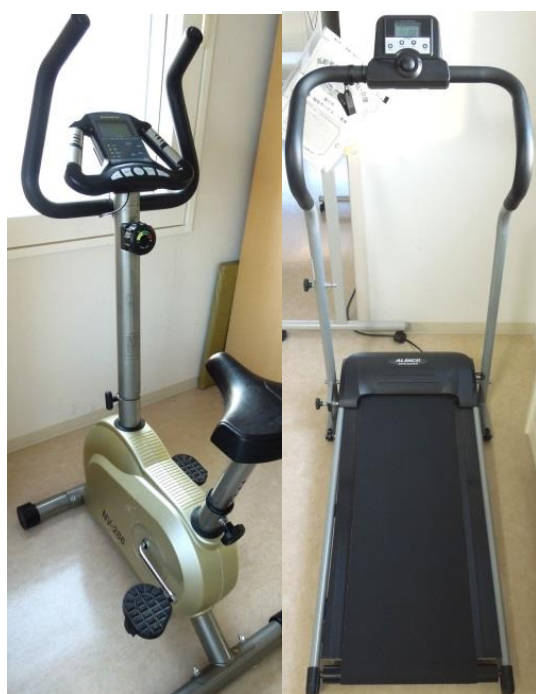
エアロバイクと電動ウォーキング マシンで運動も出来ます！