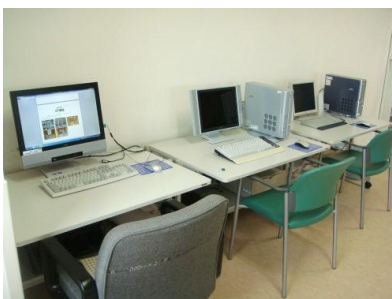
パソコン練習 (インターネット可)