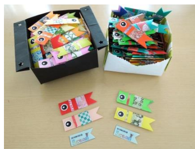
5月のカード 制作中...☆

市内の地域食堂さん、通所事業所「たんぽぽの家」さんからも内職依頼がきています♪ これから、更に地域の方々と連携していけたらと考えてます☆