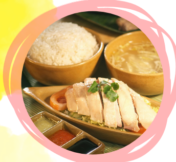
世界の料理教室 チキンライス&シフォンケーキ 10時~12時00分 定員6名 ※申込期間: 8月10日~18日 参加費: 800円