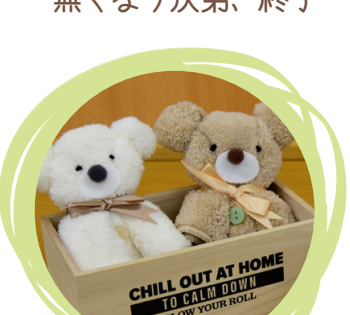
タオルくま講座 10時~15時 限定30個 参加費: 200円