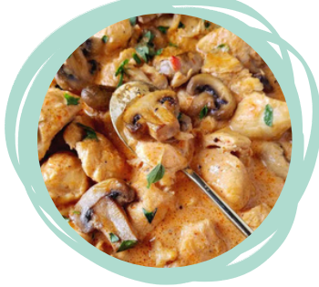
世界の料理教室 ブラジル風ストロガヌフ 13時~15時 定員6名 ※申込期間: 8月10日~18日 参加費: 800円