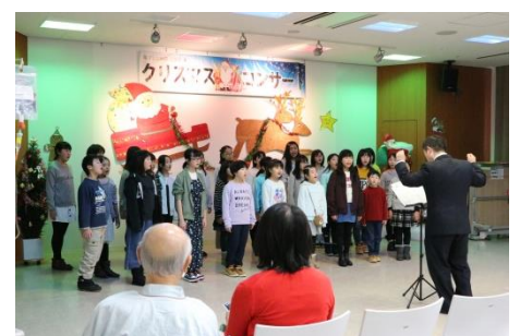
東小学校合唱部のみなさんは、小学生とは思えないほど綺麗なハーモニーで会場を魅了しました。