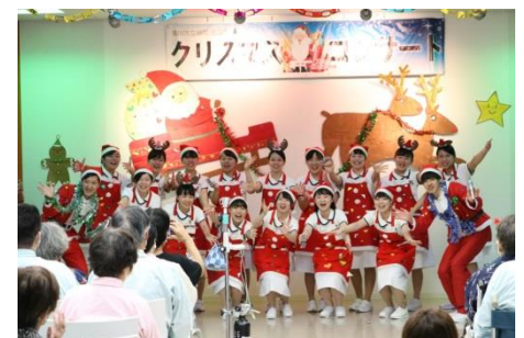
高等看護学院生の2年生の皆さん。元気なダンスで一緒に踊る患者様も。

会場内は「菜の花」応援団の皆さんにも飾り付けを協力していただきました。短い時間での開催ではありましたが、いつもと違う雰囲気の中で見に来ていただいた患者様に「楽しかったです」と喜んでいただきました。