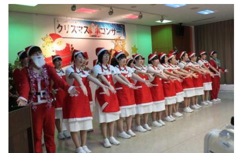
高等看護学院生の1年生の皆さん。トップバッターで緊張する中素敵な歌と踊りを披露してくれました。