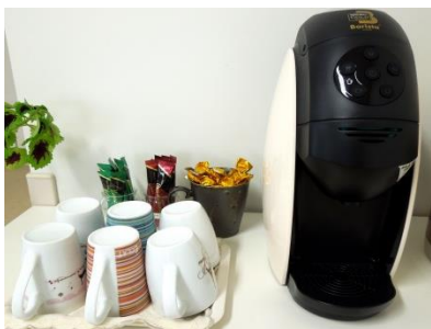
フリースタイルコーナー (ココアやコーヒーなど)