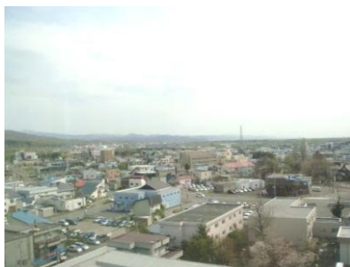
作業療法室からの景色 (市内が一望できます)