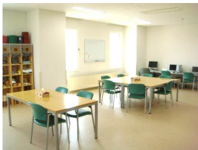
作業療法スペース

上記に当てはまる方には精神作業療法がピッタリです！！ぜひ、参加してみませんか？ 見学だけでもOKです！！