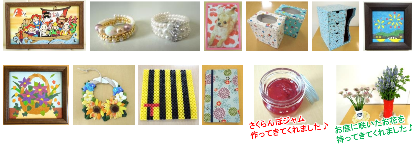
さくらんぼジャム 作ってきてくれました♪