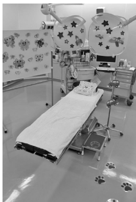
▼わくわくする楽しい飾り付け

手術室内を明るく飾り付け、手術台のタオルやシーツをカラフルにし、アニメの音楽をかけ、動物の足跡をたどっていくと手術室に入っていくように工夫しました。また、手術を受けるお子さんには、ご両親と一緒に手術前日に手術室の見学を行ってもらっています。実際に少しわくわくするような手術室の雰囲気を覚えてもらい、その子その子に合わせての手術・麻酔用のグッズを選んでいきます。手術を受けることはその子にとっても、家族にとっても特別なことであり、不安でいっぱいだと思いますが、手術後のお母さんから、「実際に手術室を見ることや、担当する看護師の明るさと優しさで安心して手術当日を迎えることができました」という言葉をいただきました。