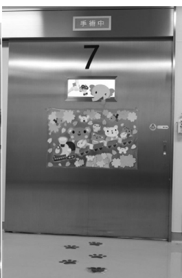
▲動物の足跡をたどって手術室へ

をとり、患者さんの思いに寄り添って、少しでも安心して手術を受けることができるように、今後も医師や病棟看護師と連携しながら看護を提供していきたいと考えています。